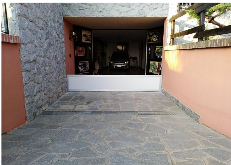
PARATIA con GUARNIZIONE ATTIVA

PARATIE con GUARNIZIONE ATTIVA PARATIE con GUARNIZIONE a PRESSIONE