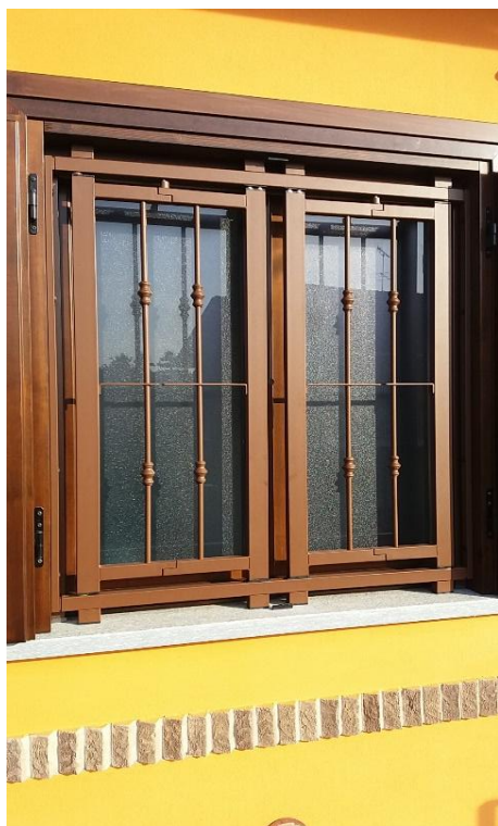
INFERRIATA con SNODI

INFERRIATE - PORTONCINI BLINDATI - SERRAMENTI ANTIEFFRAZIONE - PERSIANE BLINDATE